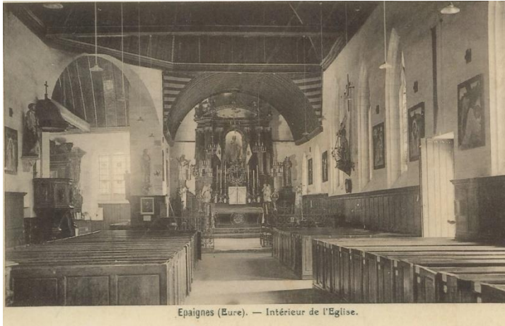
Épaignes (Eure). — Intérieur de l'Église.

La construction majeure de l'église s'est déroulée à la fin du XVe et au début du XVIe siècle. Dédiée à Saint-Antonin, c'est une des plus grandes du canton.