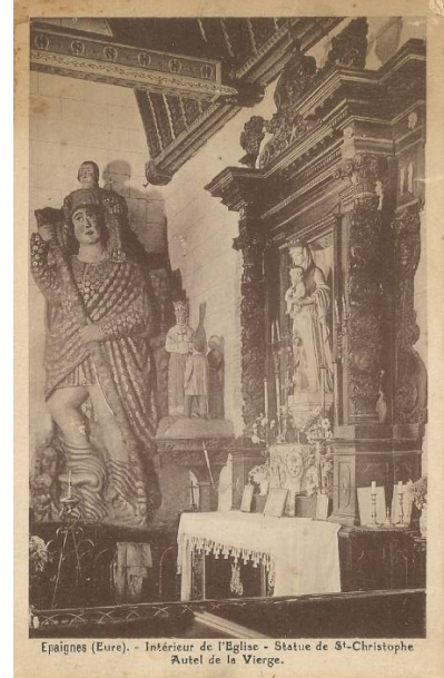
Épaignes (Eure). — Intérieur de l'Église - Statue de St-Christophe Autel de la Vierge.

Elle a malheureusement brûlé à la Libération et il ne restait que les murs.