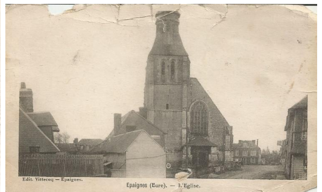
Edit. Vittecoq — Épaignes.